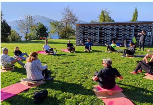
Les participants ont découvert l'exercice de la planchette valaisanne, proposée par APA santé

L'événement ayant rencontré un vif succès, il sera renouvelé l'année prochaine.