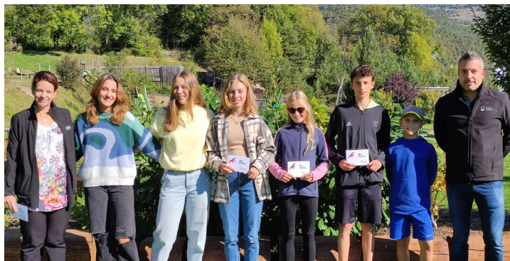
Six jeunes sportifs parmi les sept à avoir reçu un prix dans le cadre des mérites sportifs